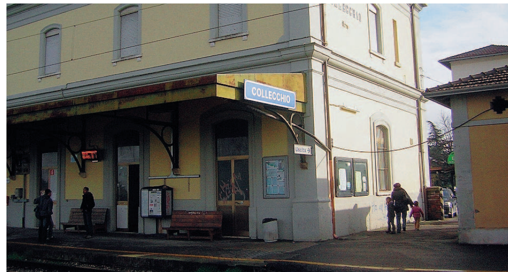
Stazione Iniziano domani i lavori di riqualificazione.

Col passare degli anni la sua funzione di stazione si è ridimensionata perché viene usata di più l'auto e di meno il treno. Ormai da molti anni non esiste più la figura del capo stazione e molti spazi all'interno della stazione stessa sono andati in disuso: come la biglietteria, gli uffici adibiti a tale servizio, alcuni spazi interni e la stessa sala d'attesa. Il Comune ha dunque concluso un ac-