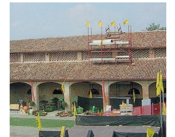
Incontro La Corte di Giarola.

Si comincia domani con un triplice appuntamento, in tutti e tre i casi con inizio alle ore 21: il bilancio di previsione e il piano delle opere pubbliche saranno presentati alla Corte di Giarola per gli abitanti di Pontescodogna, al Centro civico di Gaiano e a San Martino Sinzano nei locali delle ex scuole elementari.