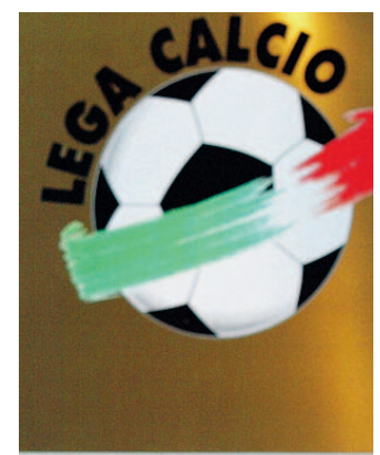
Tv Problemi per la Lega Calcio.

L'Autorità Garante della Concorrenza e del Mercato, nella riunione del 22 luglio, ha deciso di avviare un'istruttoria per verificare se la Lega Calcio, nel predisporre i pacchetti di diritti Tv di serie A per le stagioni sportive 2010-2011 e 2011-2012, abbia abusato della sua posizione dominante nella commercializzazione in via centralizzata dei diritti stessi. Secondo l'Autorità - si legge in un comunicato - le modalità di formazione dei «pacchetti» scelte dalla Lega Calcio potrebbero risultare in contrasto con i principi posti a tutela della concorrenza: i pacchetti, così come formati, appaiono ritagliati «su misura» dei principali operatori di pay tv, con l'effetto di non garantire lo svolgimento di una procedura effettivamente competitiva e di ostacolare l'ingresso e la crescita di altri soggetti. In particolare la Lega Calcio sembrerebbe aver preferito determinare le condizioni per una minore competizione tra gli operatori della pay tv nello sfruttamento dei diritti, per assicurarsi gli introiti attesi, limitando l'incertezza legata al risultato della gara. Il minore grado di concorrenza tra gli operatori della pay tv che ne potrebbe derivare può evidentemente avere effetti negativi sui consumatori, che potrebbero dover pagare prezzi più alti a fronte di