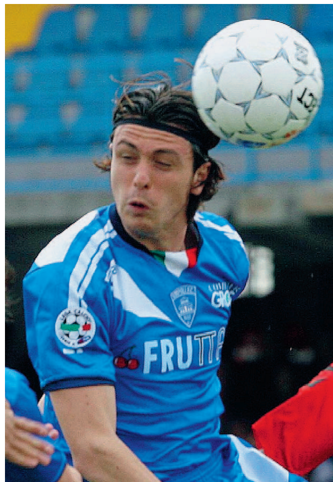
Bomber Nicola Pozzi: il Parma lo insegue con convinzione.