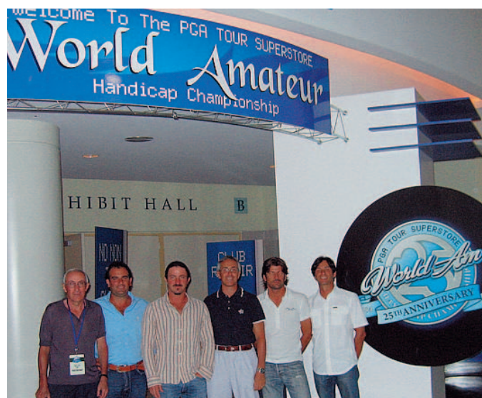
Americani i parmigiani al World Am di Myrtle Beach 2008.