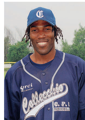
Sul monte Bova e Sena, probabili partenti domani nel Collecchio.

Il Collecchio insegue un risultato positivo che possa servire sia per dimenticare in fretta le brucianti sconfitte subite nel derby della scorsa settimana, sia per allontanarsi dalle zone più pericolose della classifica.