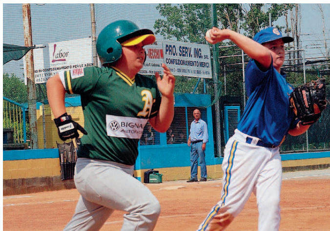
Torneo internazionale Una fase del Due Torri.