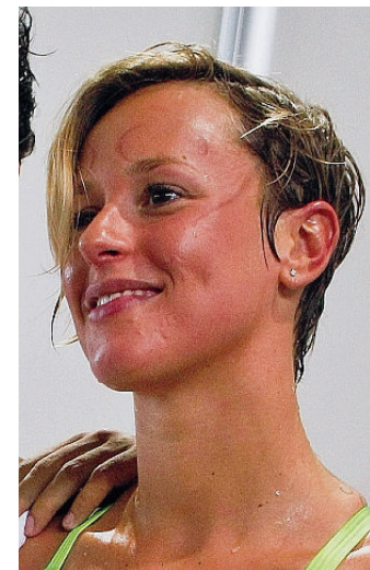
Bronzo Federica Pellegrini.